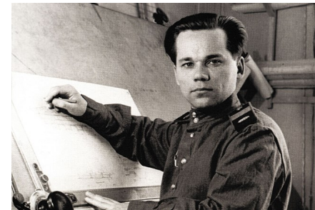
Изобретатель стрелкового оружия Михаил Калашников

Восхищения комиссия не испытала, так как, по мнению специалистов, оружие является дорогим и сложным. Для сравнения брали ППШ и ППС. Несмотря на это, талант конструктора заметили.