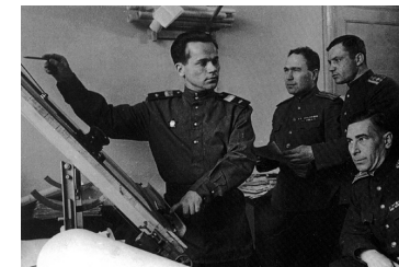
Михаил Калашников разрабатывает знаменитый автомат

В 1942 году Михаила Тимофеевича берут на службу в Главное артиллерийское управление Красной Армии. Мужчина поставляет вооружение в ряды военнослужащих. Руководство вскоре дало Калашникову новую задачу: конструктору требовалось разработать оружие, взяв за основу «промежуточный» патрон калибром 7.62x39 мм. Пистолет или автомат должны обладать дальностью выстрела на 200-800 метров.