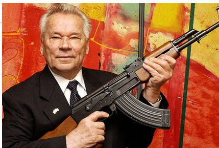
Михаил Калашников и его автомат